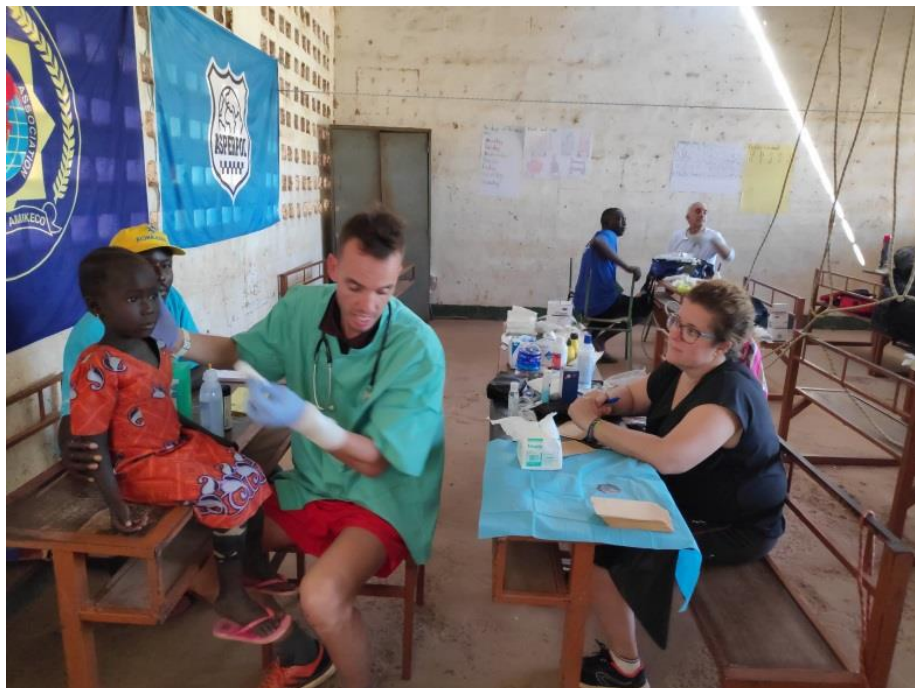
12. Equipo sanitario atendiendo a niños.