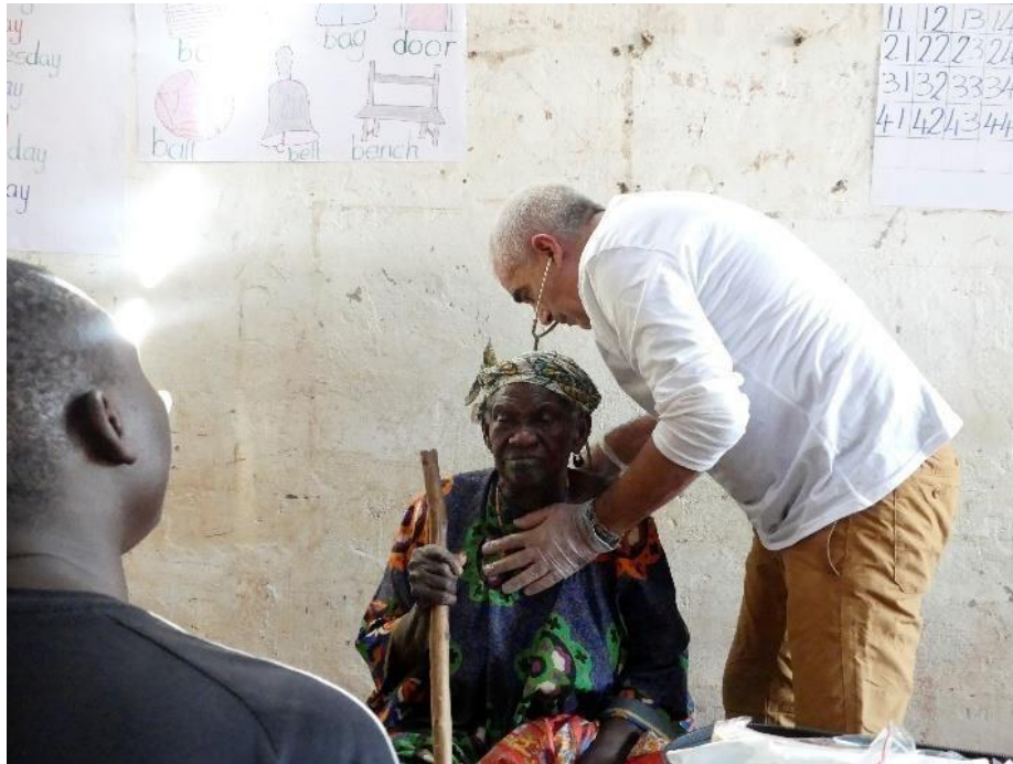
13. Medico pasando consulta en la escuela.

Nuestro equipo sanitario organizó una pequeña clínica para pasar consulta en el interior de la escuela, en la que, se pasó consulta médica, al poblado de Jarra Sukuta y también se asistió a la Clínica Rossi en Pakali-Ba, durante tres días se visitaron aproximadamente a 250 personas. Se atendieron todo tipo de casos; desde niños con malaria, sarna, luxaciones, roturas óseas, hasta personas de avanzada edad con enfermedades crónicas. Que denotaban una falta de asistencia sanitaria continua.