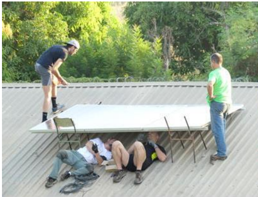
7. Colocación de placas

La colocación del equipo fotovoltaico que consta de 6 placas, en un módulo de la escuela dotó de electricidad a tres clases del centro, donde se encuentra el despacho de dirección, siendo el módulo principal de la escuela, también se realizó la colocación de tres focos exteriores, que iluminan la parte exterior de la escuela, ampliando considerablemente las horas de uso de la actividad de juego y reunión para las personas del poblado.