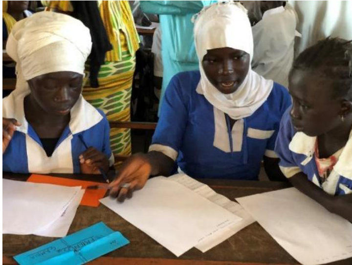
1. Menores de la Escuela Jarra Sukuta participando de la actividad, la carta viajera. 2.

El trabajo realizado en las clases animó y dio visibilidad al proyecto de ASPERPOL, ya que, los propios menores explicaron el proyecto a sus familias, notándose tanto el impacto, en la gran respuesta de este centro educativo en la recogida de material educativo por parte de las familias, como en el aumento de seguidores en las redes sociales de nuestra ONGD.