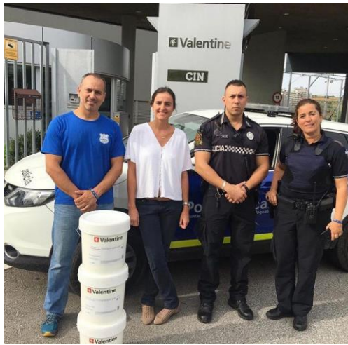
6.Entrega de pintura de la empresa Valentine a Asperpol.