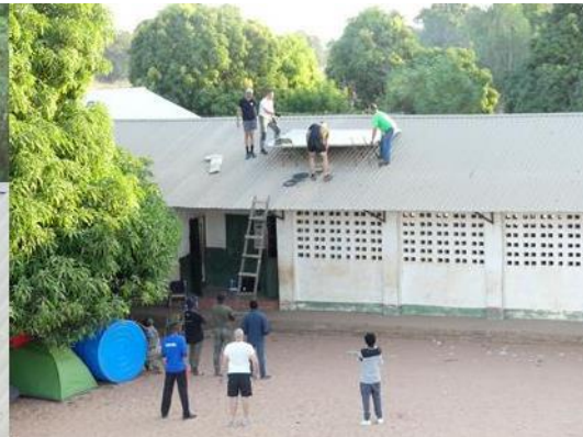
8. Cooperantes colocando las placas solares en el techo de la escuela.