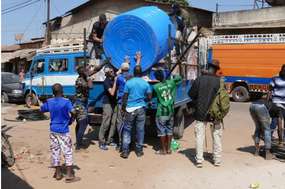
11. Compra y transporte depósito de agua.

El depósito se compró en un mercado local y fue transportado hasta la clínica junto con el resto de material.