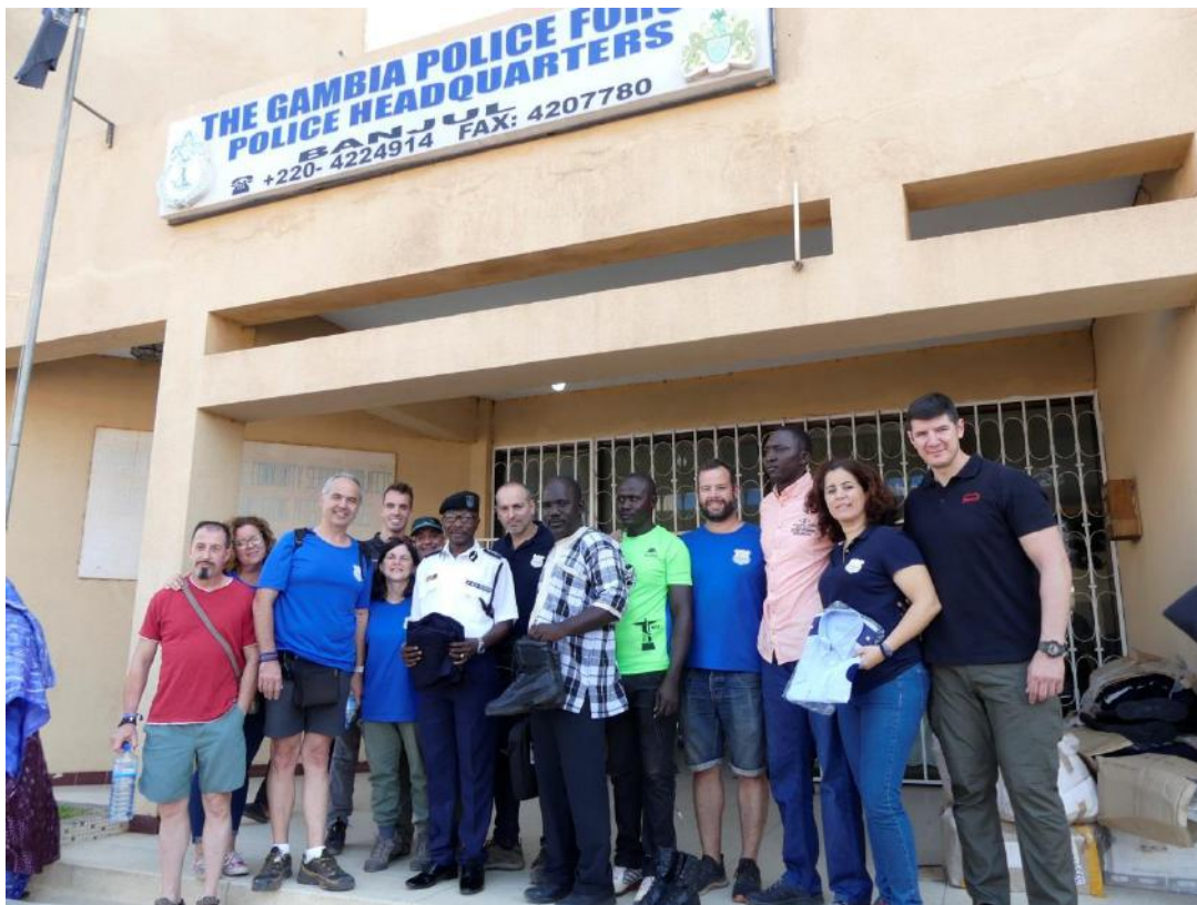
15. Entrega de material policial en Banjul

La policía de Catalunya los últimos años, ha realizado un cambio de uniformidad, lo que permitió hacer una recogida del material descatalogado y poder hacer llegar gran material de uniformidad y calzado. La policía en Gambia al igual que toda su población, realizan trabajos sin los recursos mínimos para realizarlos con cierta garantía, hecho que hace a veces difícil el desempeño de sus funciones. El material se entregó en la jefatura de la policía en Banjul, excepto algunas piezas que se entregaron por el camino al poblado a diversos policías, que se encontraban en la ruta.