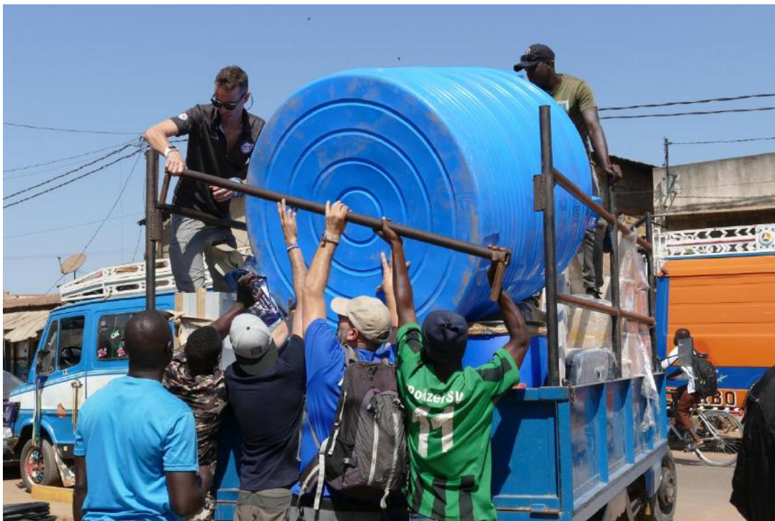
12. Compra y transporte depósito de agua.