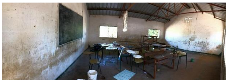
4. Estado de un aula de la Escuela antes de la intervención.

La empresa Valentine, donó una partida de bidones de pintura, para poder pintar el interior y exterior de la escuela, los cooperantes junto a los jóvenes del poblado pintaron todo el interior y exterior de la escuela constando de 6 clases repartidas en dos módulos.