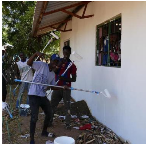
7.Jóvenes del poblado pintando la escuela.