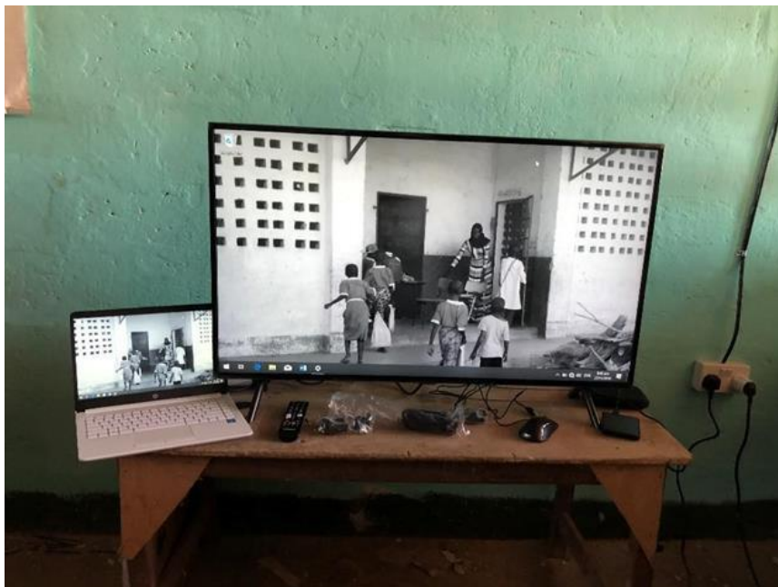
3. Material informático para la escuela de Jarra Sukuta.

Se entregó material informático a la escuela, un ordenador, una impresora, una televisión y un disco duro con diferente material educativo, para trabajar diversas materias, algo que el equipo docente valoró enormemente.