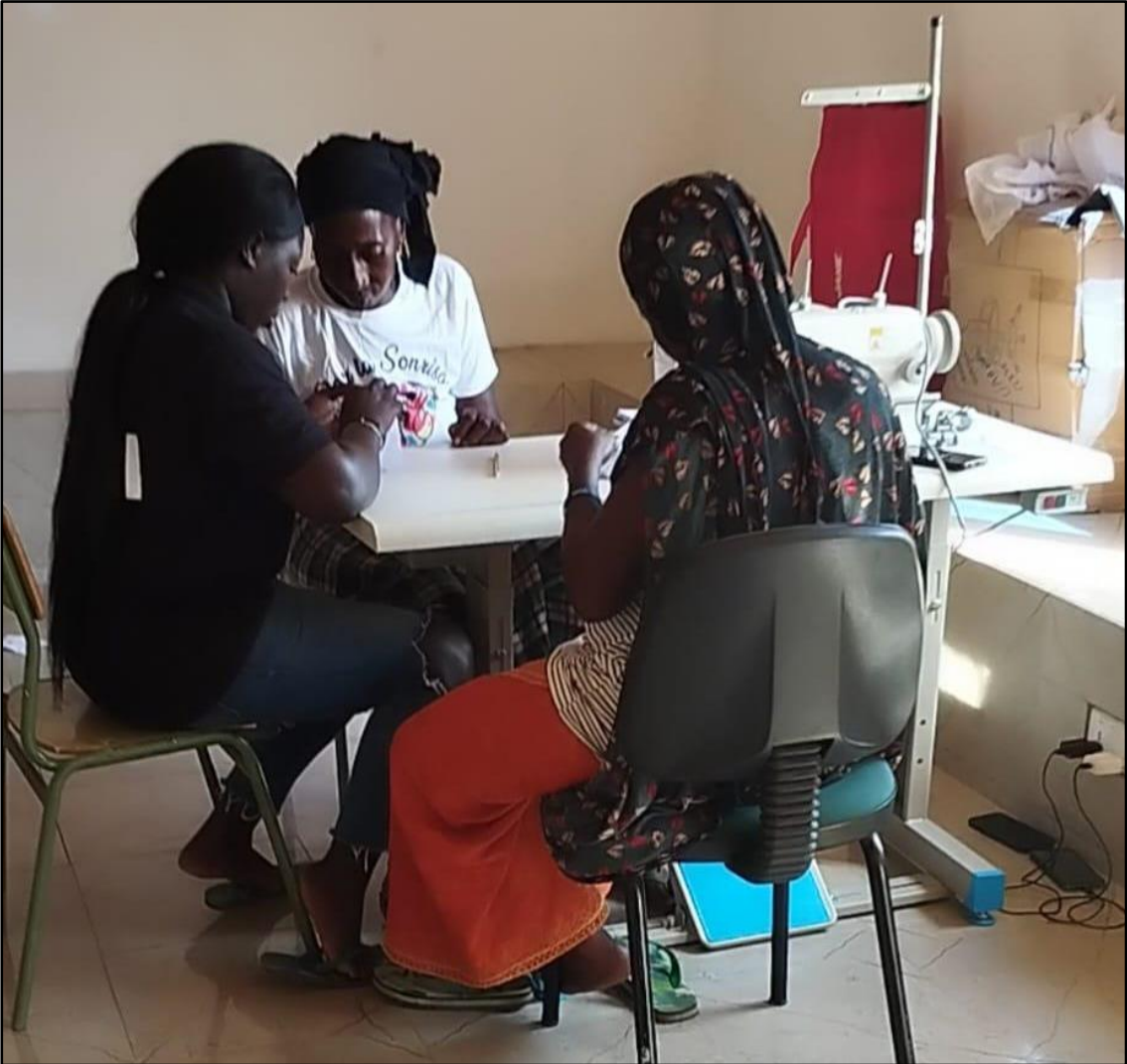
Cooperativa de Jarra, formación en costura