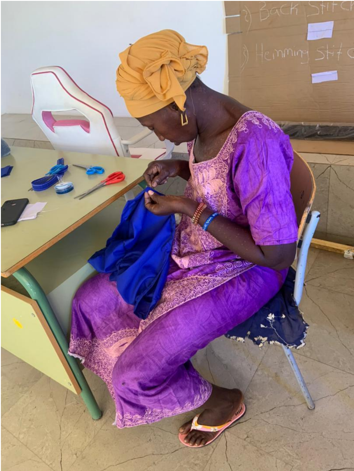
Formación en la cooperativa