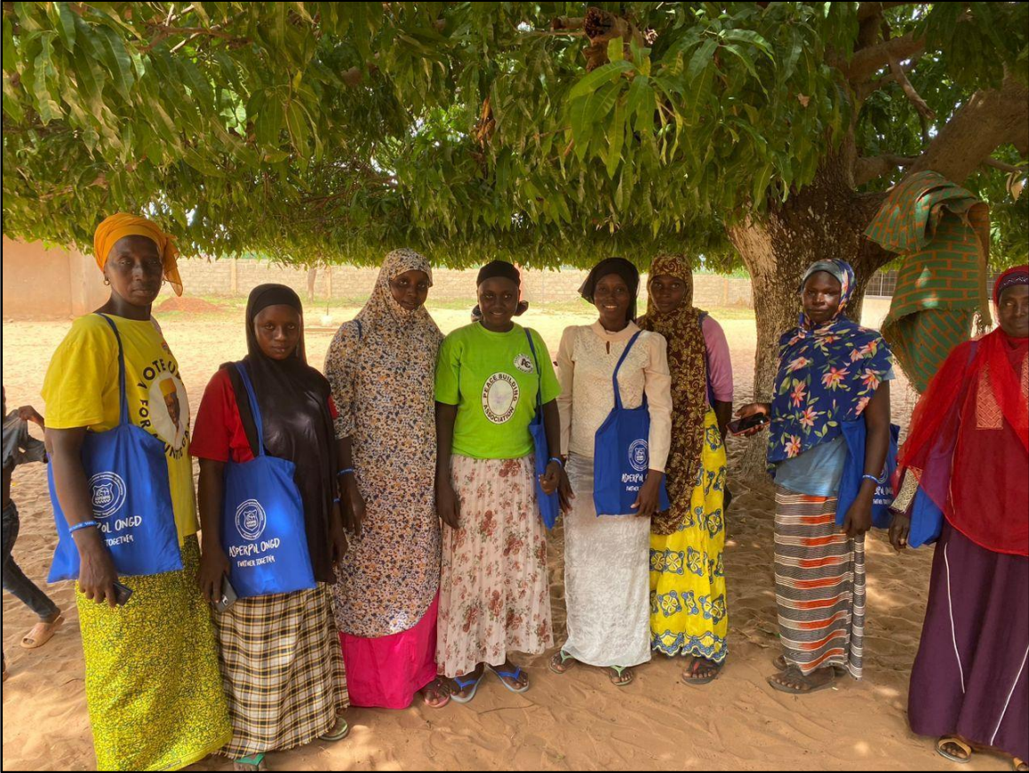
Escuela de Jarra Sukuta, Entrega de material educativo para la formación