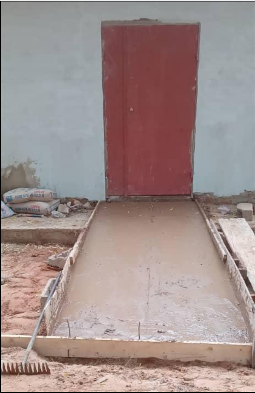
Obras de construcción de la cooperativa