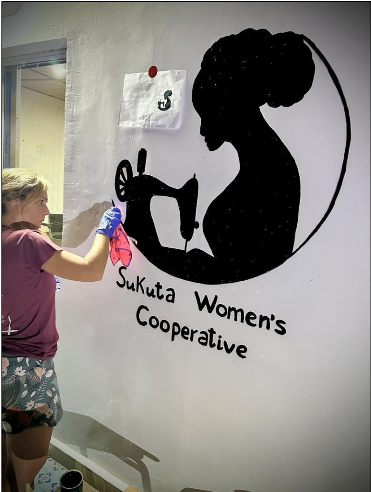
Identidad visual cooperativa