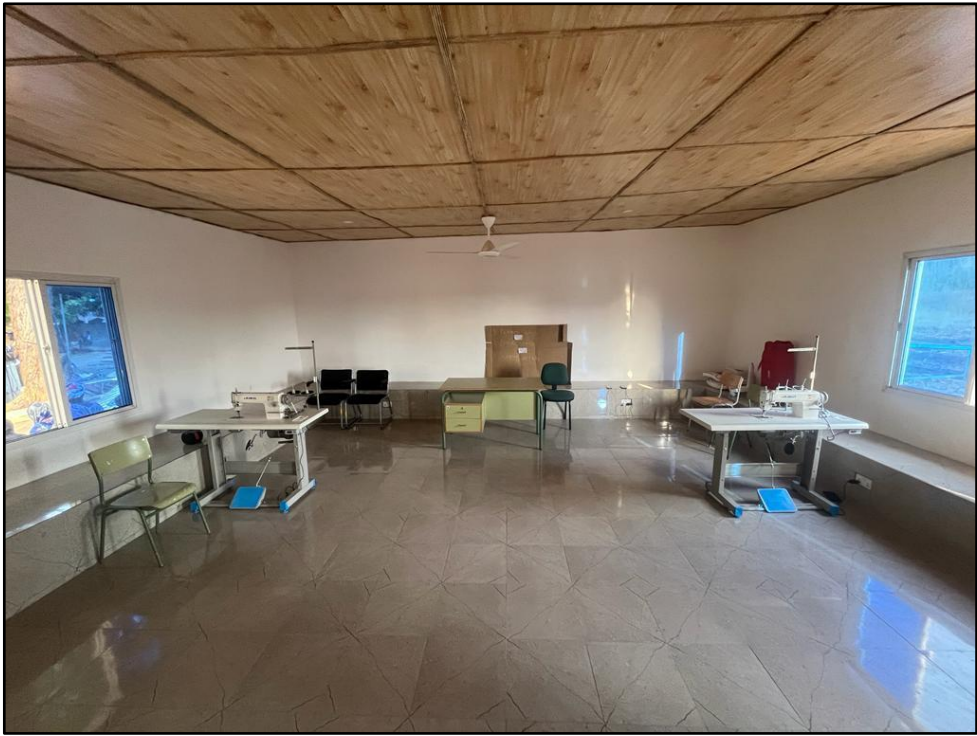
Después de la rehabilitación