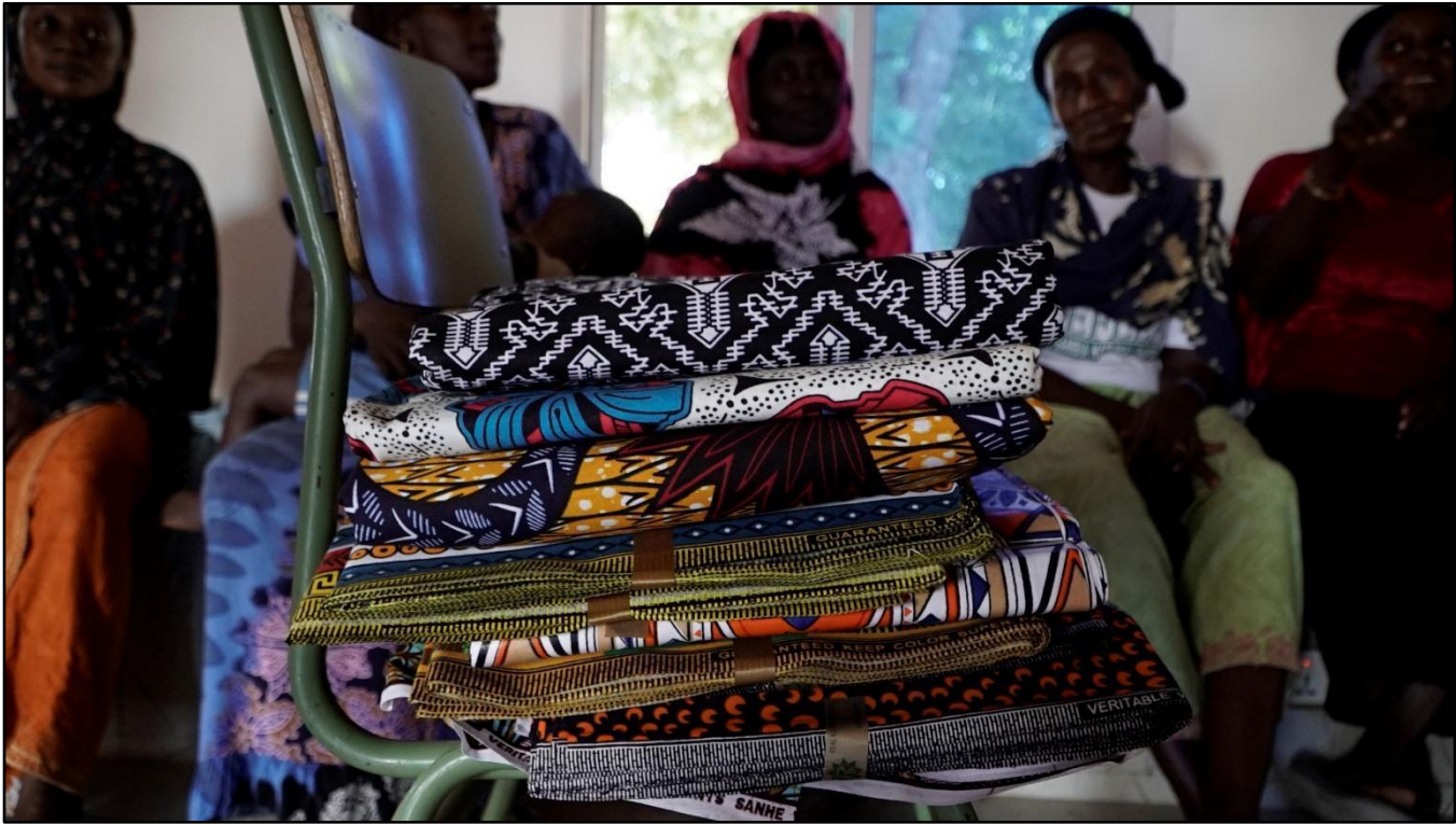
Material para comenzar la Cooperativa