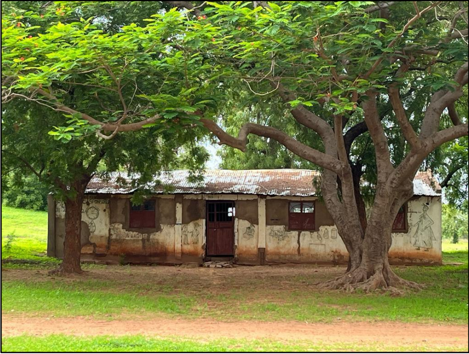
Antes de la rehabilitación y construcción