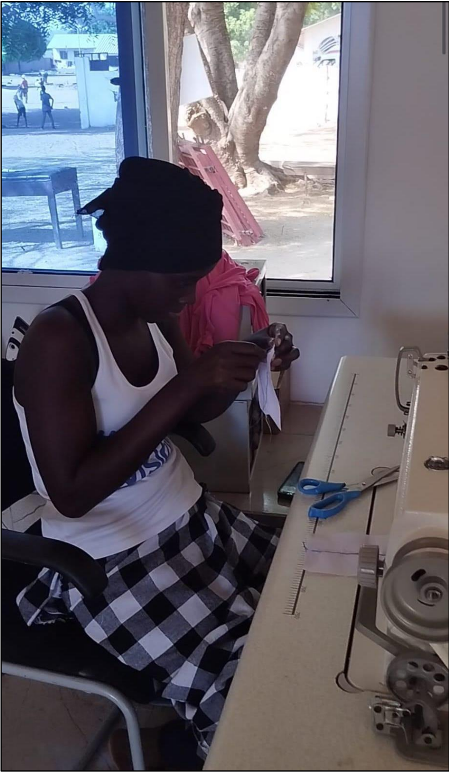
Cooperativa de Jarra, formación en costura