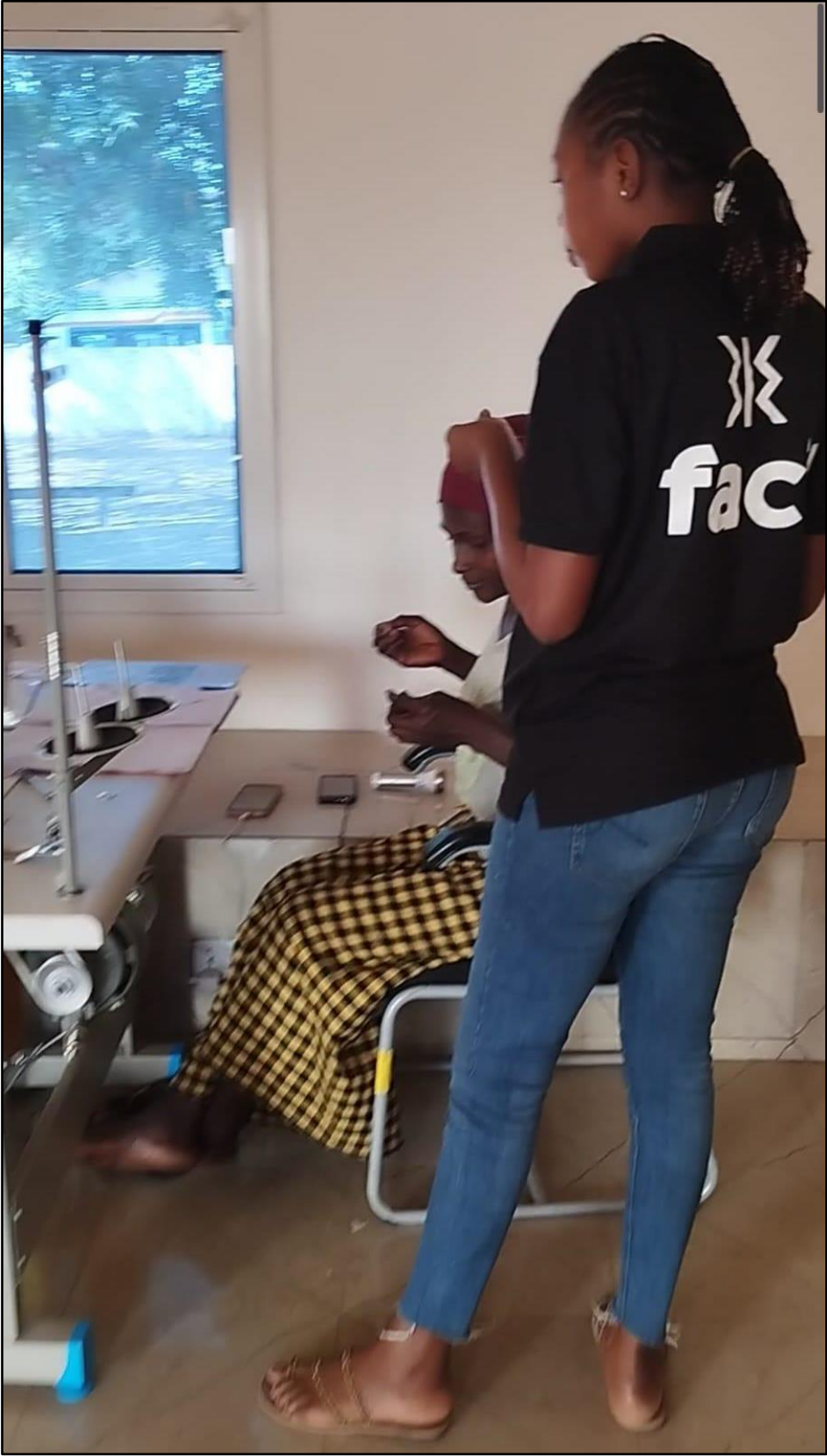
Cooperativa de Jarra, formadoras de Facil Clothing