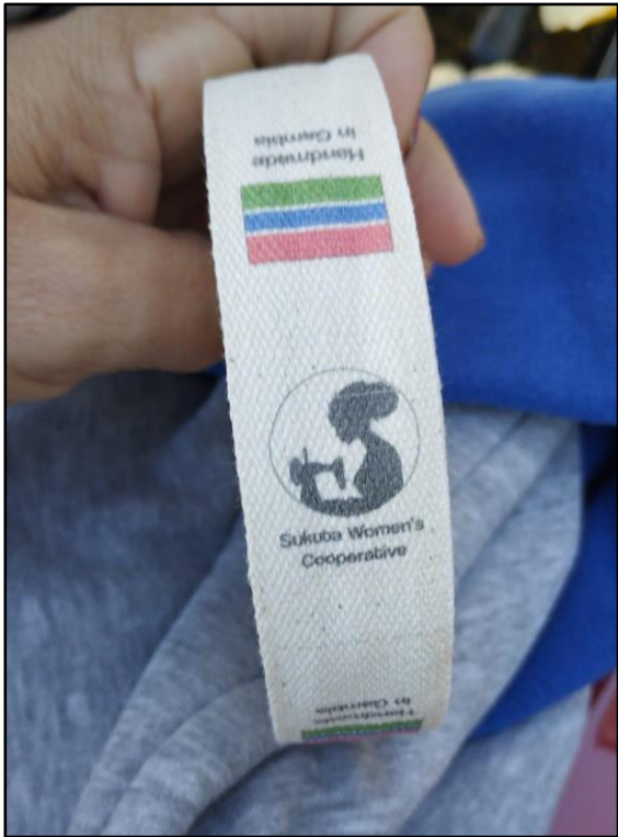
Cinta con la identidad visual para las creaciones