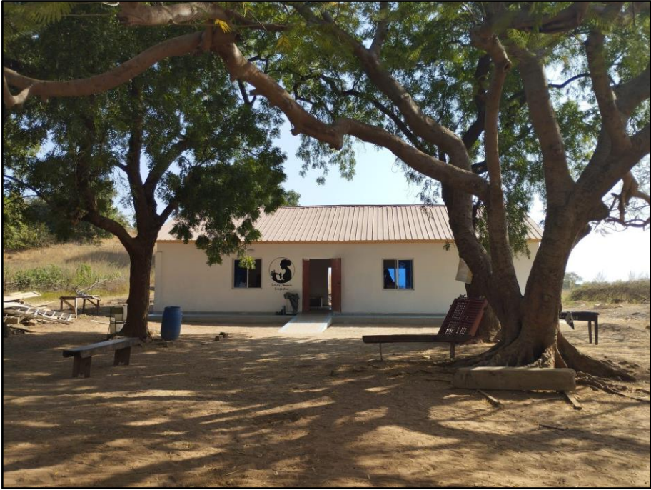
Después de la rehabilitación y construcción